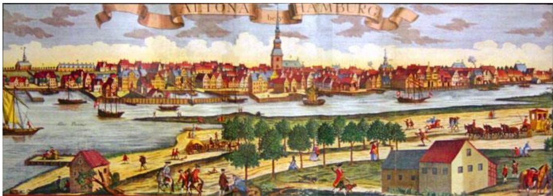
המבורג, ציור בן התקופה המדוברת