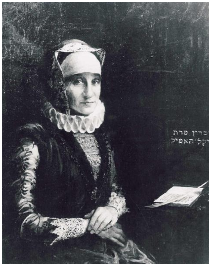
ציור מהמאה העשרים המבקש לדמות את גליקל מהמלין

אני תפילה שכן נוכל להתחבר ולהשוות עצמנו לדבריה של גליקל: "איננו יכולים לשבח ולהודות די הצורך לאל עליון שנטה לי, אמתו הלא ראויה, חסד ורחמים רבים כ"כ... כי בכל מה שהאל הגדול והחנן מזמן לי, אכן אני חשה ורואה שחסדו הגדול ורחמיו קיימים".